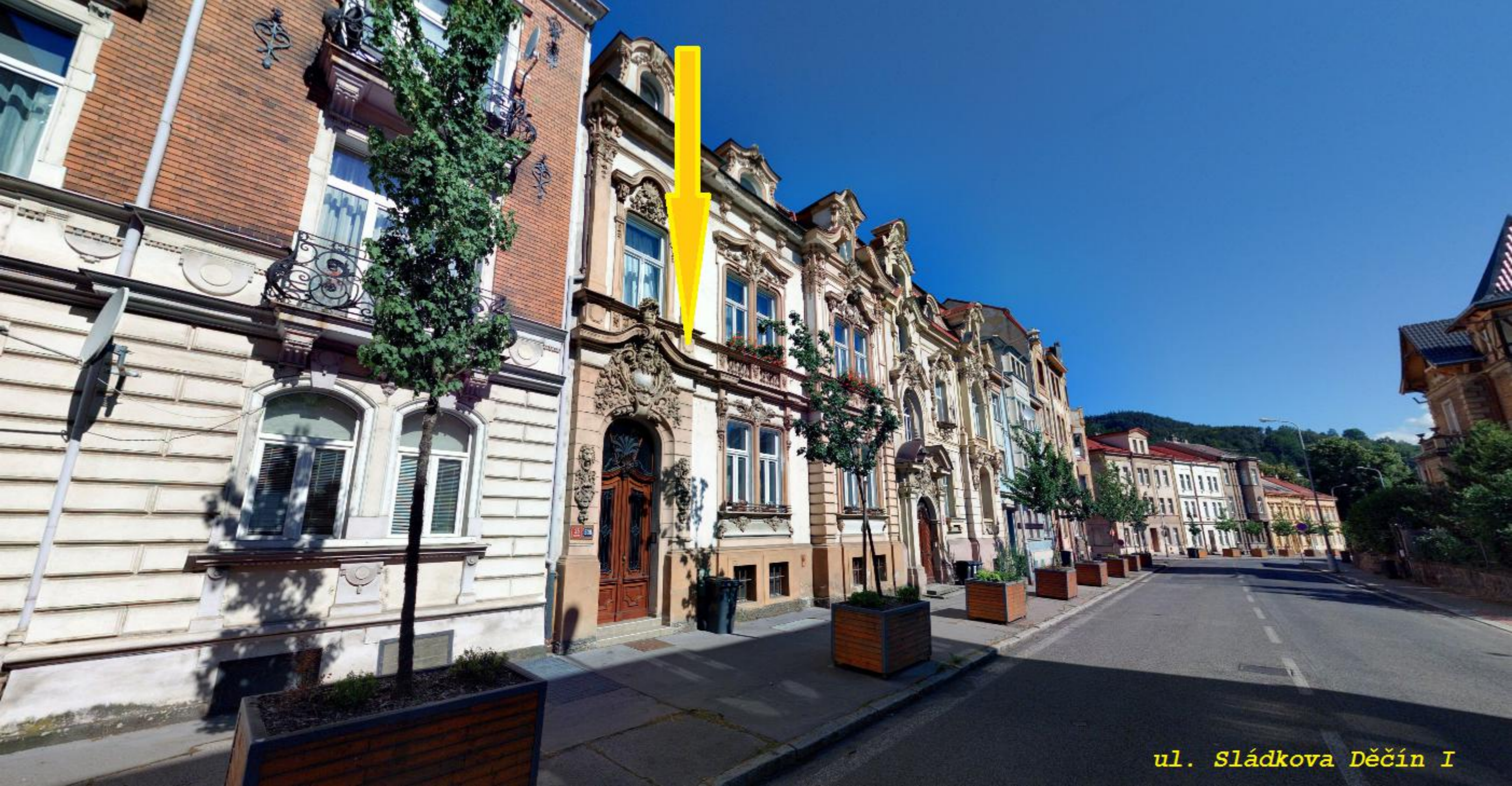
ul. Sládkova Děčín I