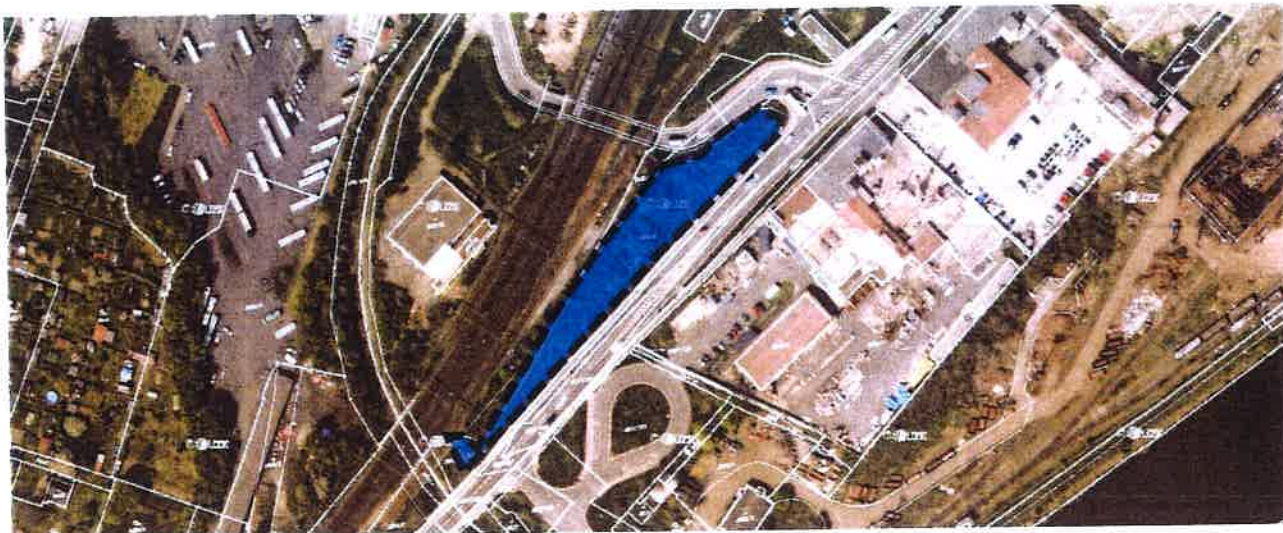
Obr.: vyznačení předmětné plochy na podkladu katastrální mapy a na podkladu platného územního plánu

Námítky mají partikulární charakter – jejich zohledněním nebude měněna ani dotčena základní koncepce rozvoje území a jeho hodnot, popř. další navazující koncepce územního plánu. Navrhované námítky tyto koncepce respektují a svým řešením na ně navazují.