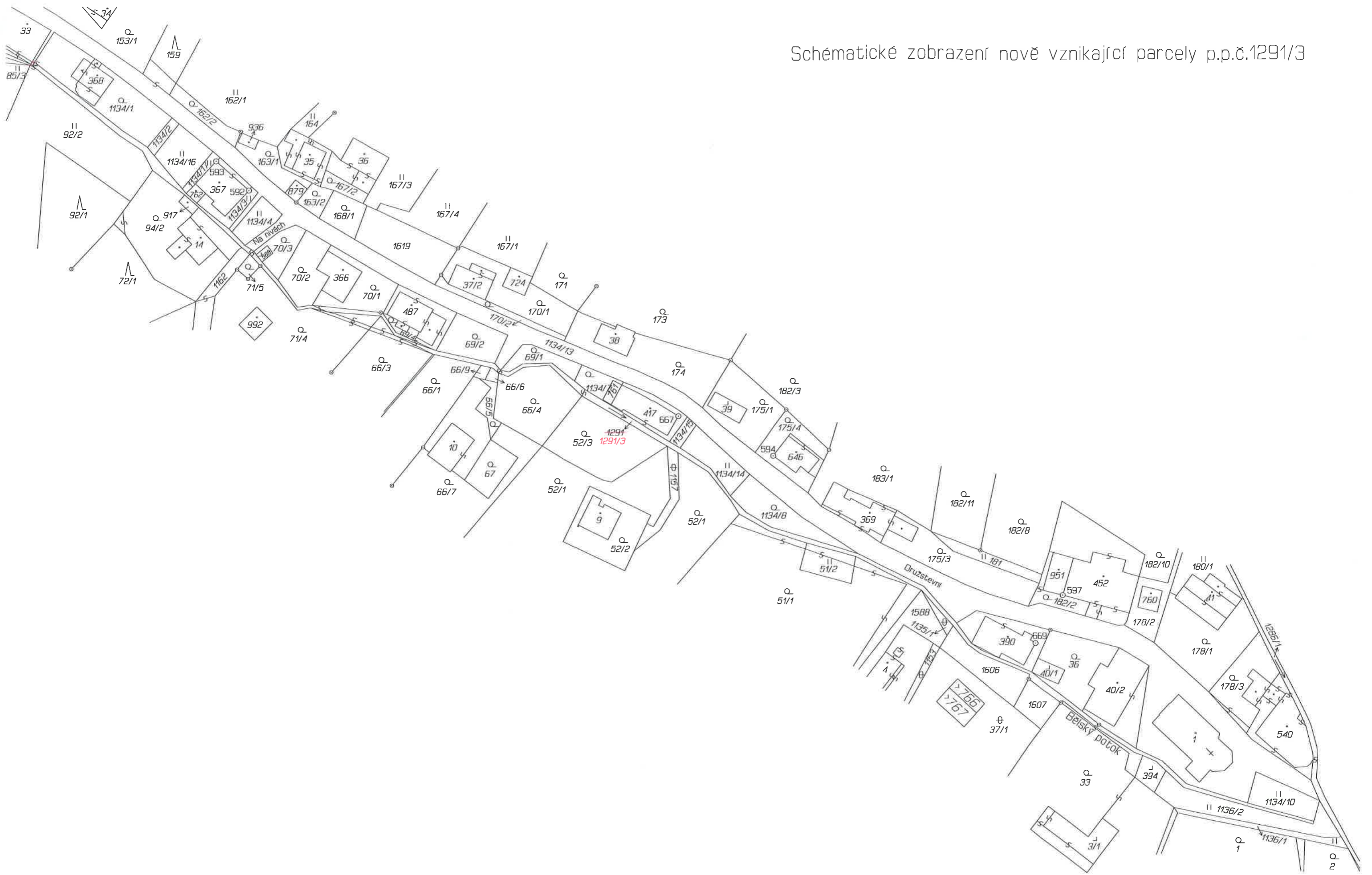
Schématické zobrazení nově vznikající parcely p.p.č.1291/3