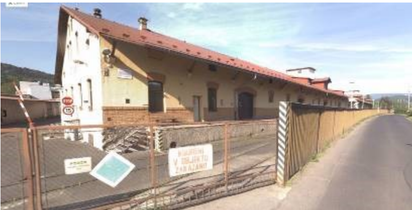
Hlavní vjezd z ulice Krokova a skladová hala s kanceláří