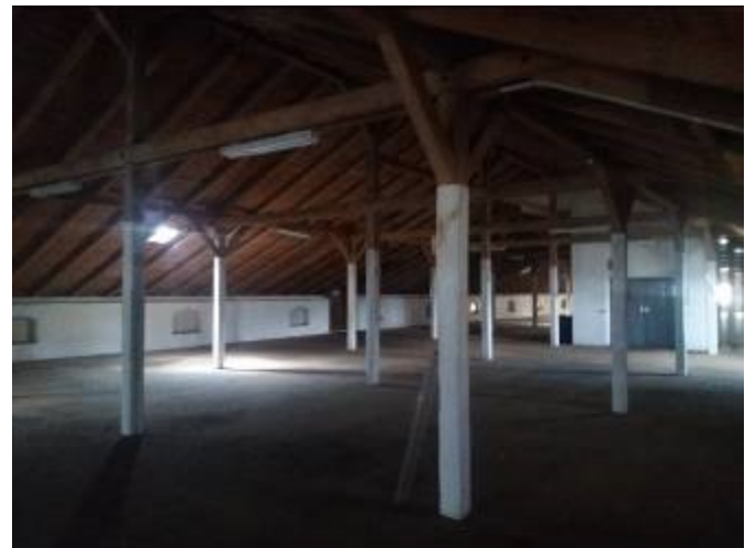
Vnitřní prostory (1.NP a 2.NP) běžné skladovací patrové haly s nákladním výtahem