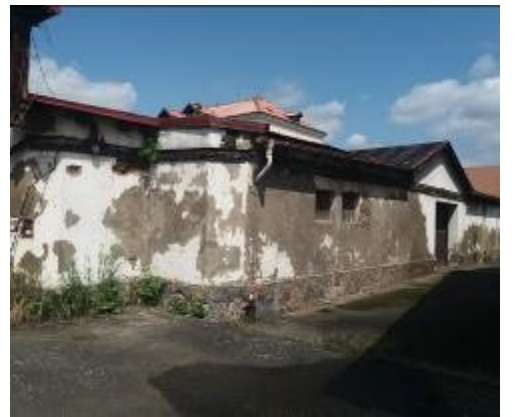
Objekt určený k demolici