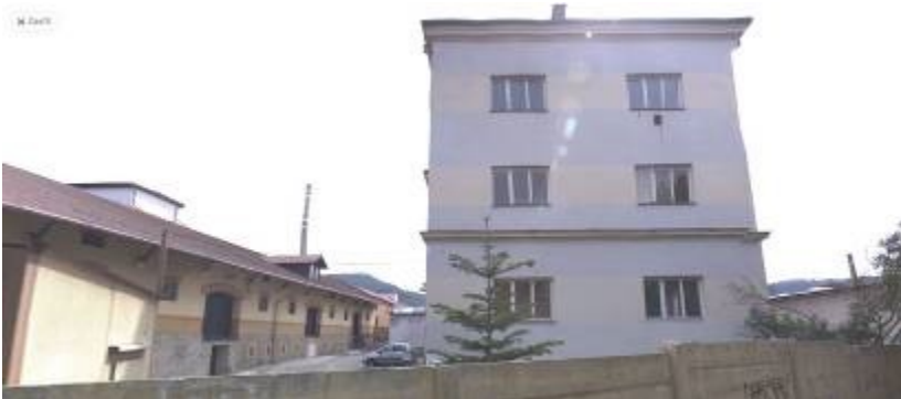
Správní a administrativní budova s bytem