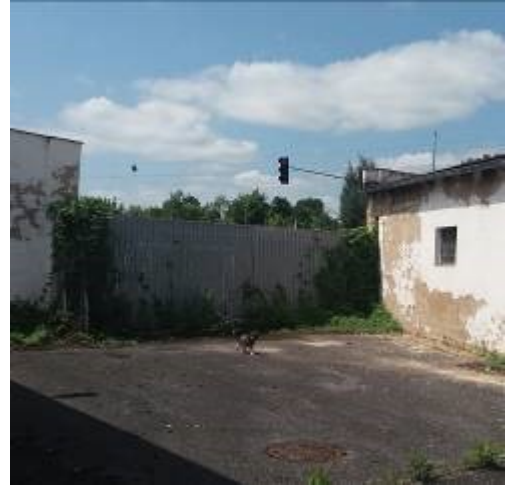
Vjezd do ulice Mostní