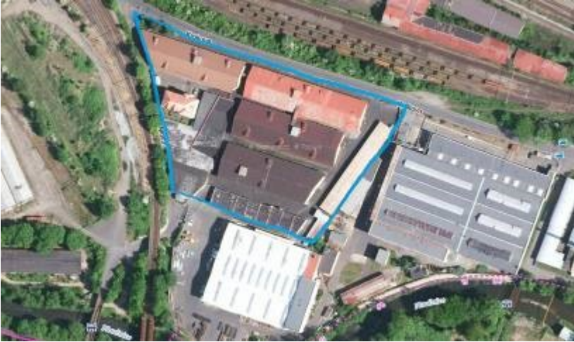
Letecký pohled na areál a okolí