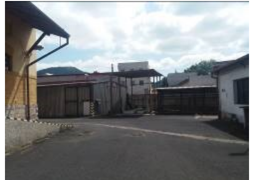
Plechová hala, "autohever", komunikace, ..