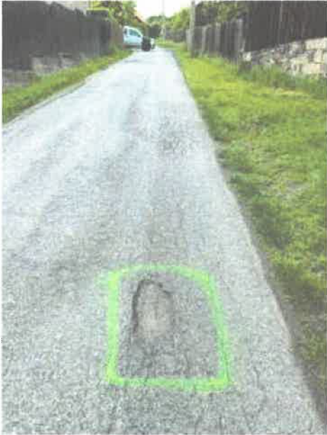
50.76264N ; 14.15185