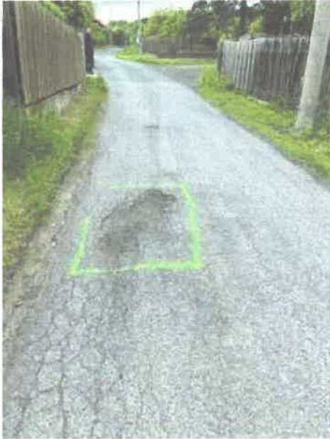
50.76267N ; 14.15163E