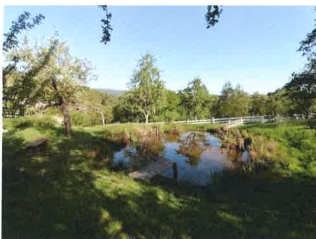
Košár V Trojmezí