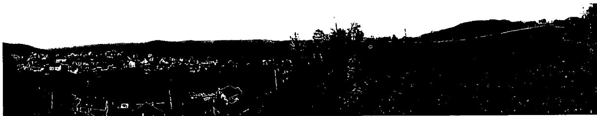
Obrázek 1 celkový pohled na místo