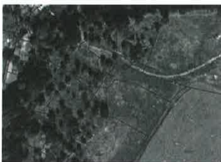
Stav hospodaření ještě v roce 1975