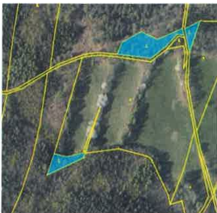
Nabízené lesní pozemky ke směně

přílohy: - snímek katastrální mapy + fotografie