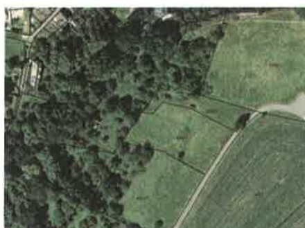
Stav biodiverzity ještě v roce 2002