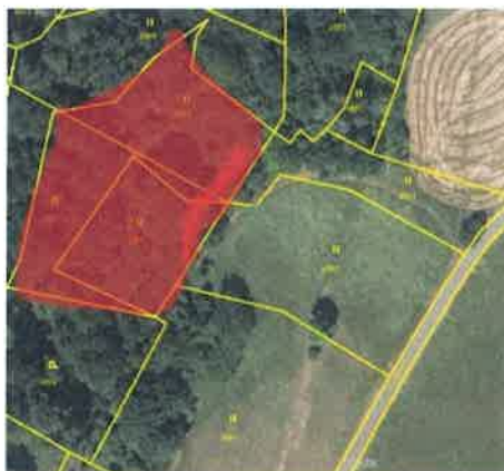
Svažitá trvalé travní porosty města