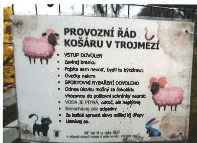
Provozní řád košáru