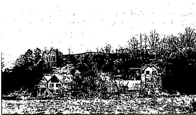
Obrázek 2 pohled na vyhlídku od zástavby