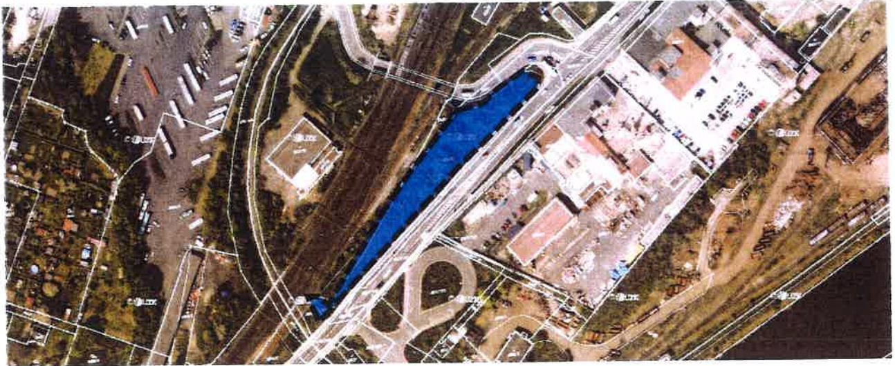
Obr.: vyznačení předmětné plochy na podkladu katastrální mapy a na podkladu platného územního plánu

Námítky mají partikulární charakter – jejich zohledněním nebude měněna ani dotčena základní koncepce rozvoje území a jeho hodnot, popř. další navazující koncepce územního plánu. Navrhované námítky tyto koncepce respektují a svým řešením na ně navazují.