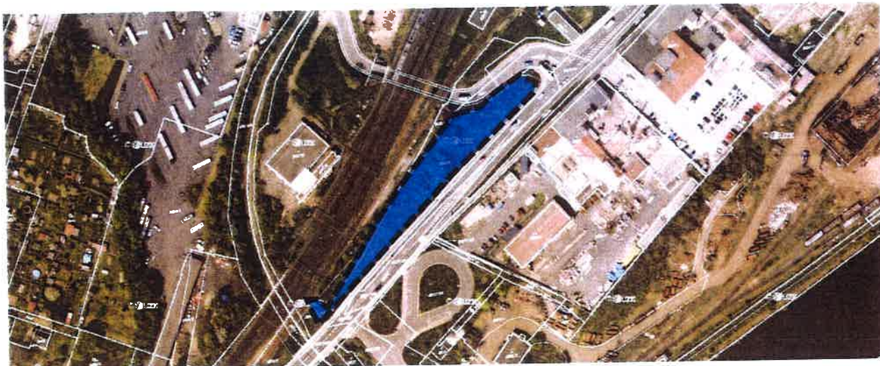
Obr.: vyznačení předmětné plochy na podkladu katastrální mapy a na podkladu platného územního plánu

Námítky mají partikulární charakter – jejich zohledněním nebude měněna ani dotčena základní koncepce rozvoje území a jeho hodnot, popř. další navazující koncepce územního plánu. Navrhované námítky tyto koncepce respektují a svým řešením na ně navazují.