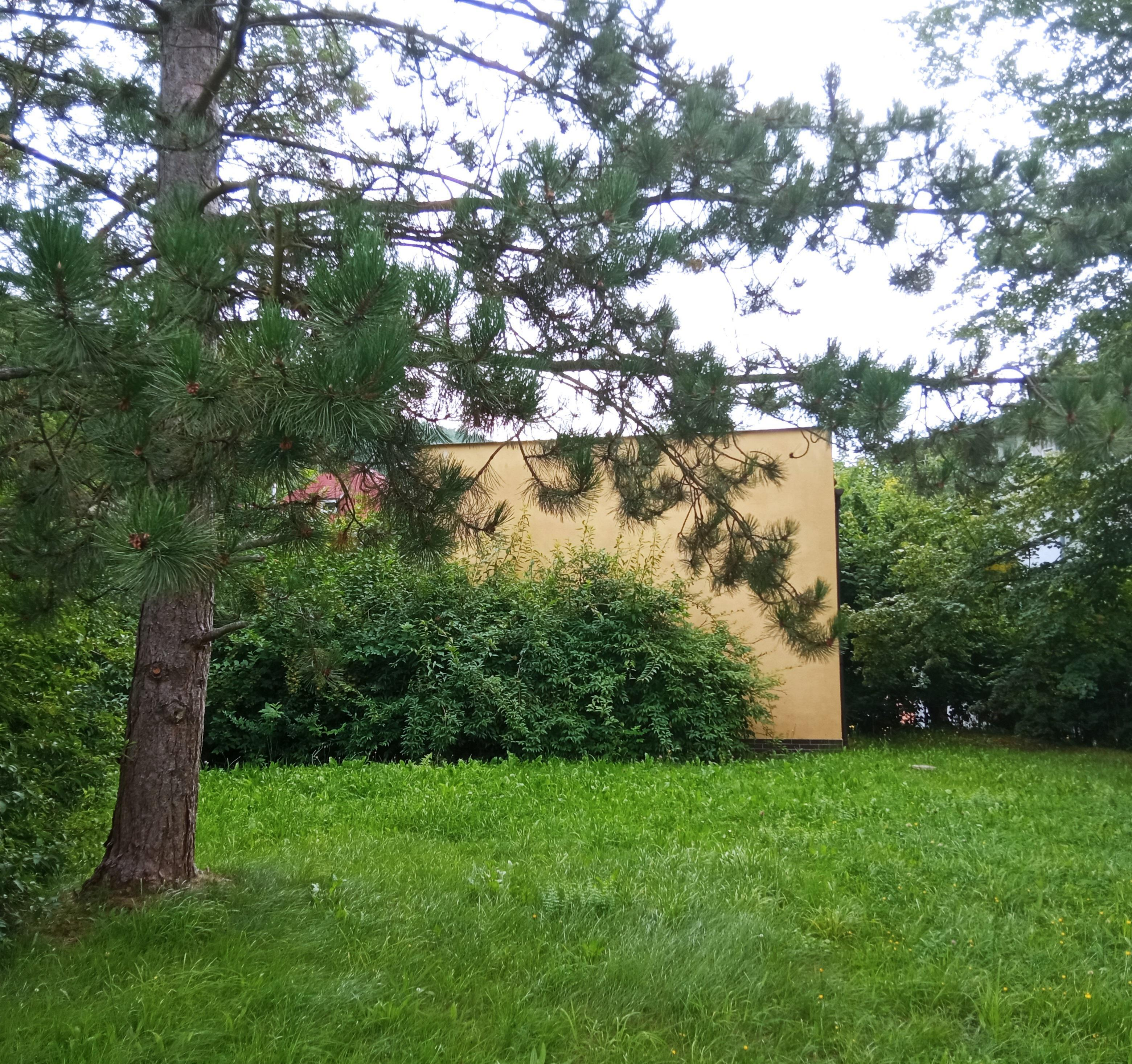
Současná trafostanice - ul. Jindřichova