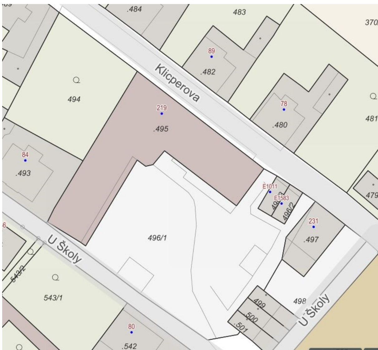
Obr. 1 – výsek z katastrální mapy

V tuto chvíli nelze spolehlivě určit, na jak dlouhou dobu bude lešení nezbytné. Dle slov zhotovitele až na 9 měsíců.