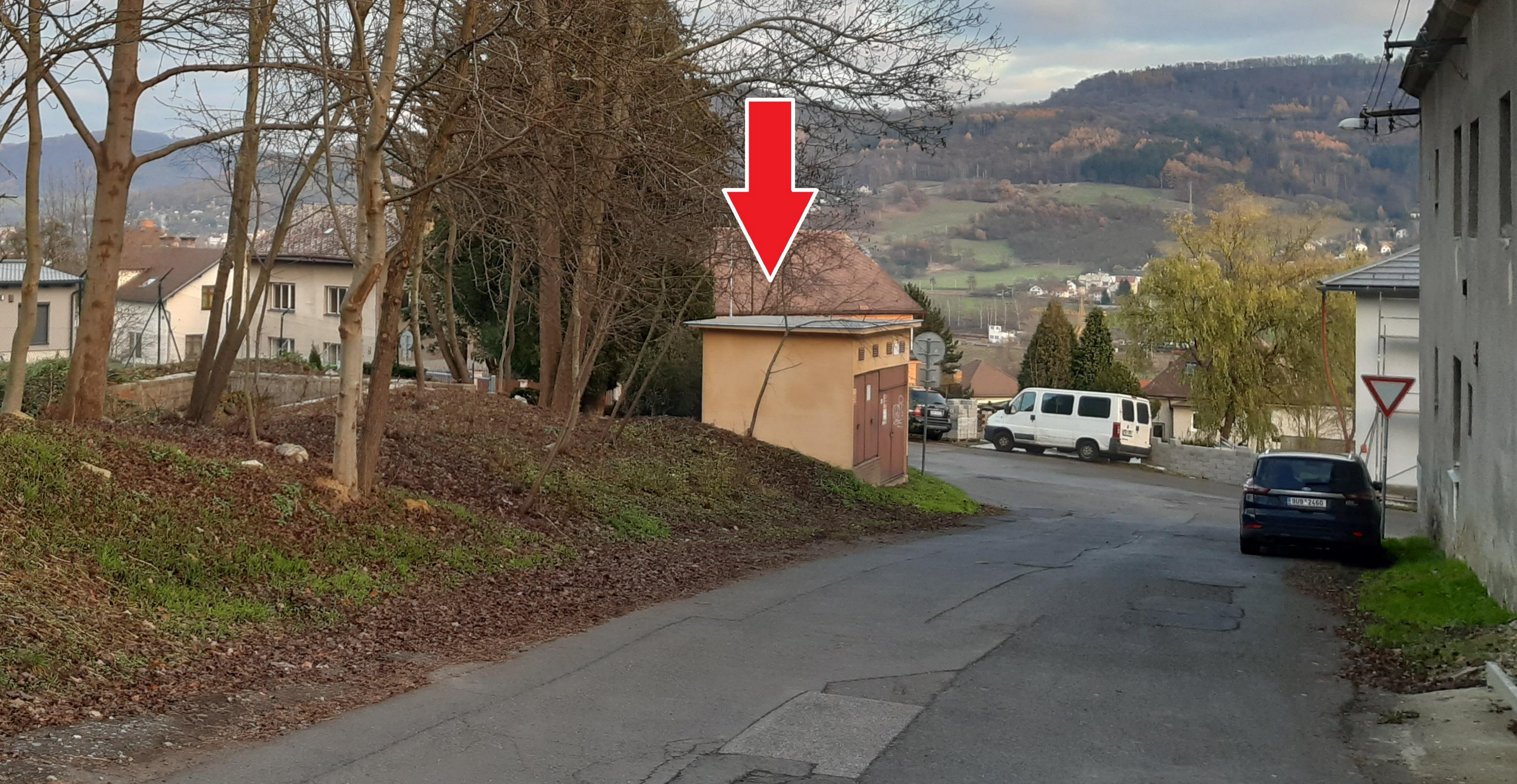
Prodej pozemku p. č. 677/5 a části pozemku p. č. 677/1 k. ú. Chrochvice